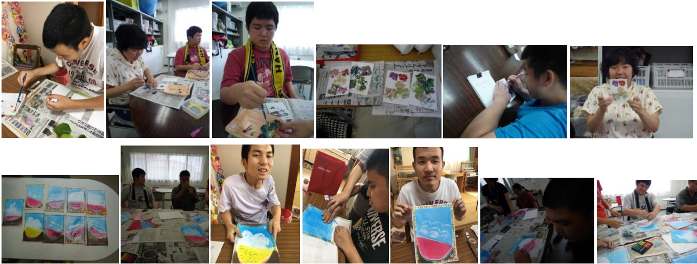
【お茶教室】真剣さと笑顔。いいですね！！